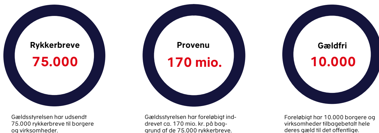
Figur 2. Nøgletal for sommerens rykkerindsats

Gældsstyrelsen har i begyndelsen af november intensiveret indsatsen, og påbegyndt udsendelsen af over 400.000 rykkerbreve til borgere og virksomheder vedrørende gæld for ca. 58 mia. kr.