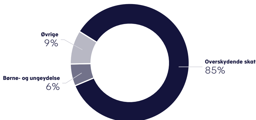
Figur 2. Fordeling af modregningsprovenu i 2021

Udover modregning i overskydende skat blev der modregnet knap 170 mio. kr. i børne- og ungeydelse, svarende til 6 pct. af det samlede modregningsprovenu i 2021. De resterende ca. 260 mio. kr. stammer fra modregning i andre offentlige udbetalinger som fx udbetaling af landbrugsstøtte.